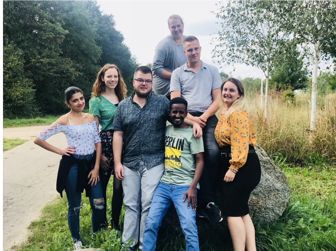
Team 2GetThere ZO Drenthe